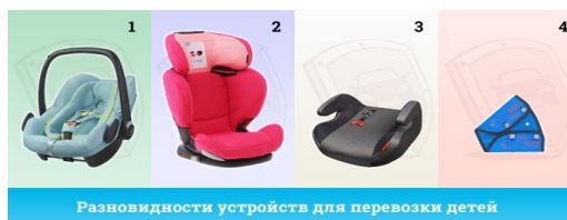
Разновидности устройств для перевозки детей

Бустер (сиденье подкладка) — ДУУ в виде сиденья с пазами для ремня безопасности. Предназначено для детей от 15 кг.